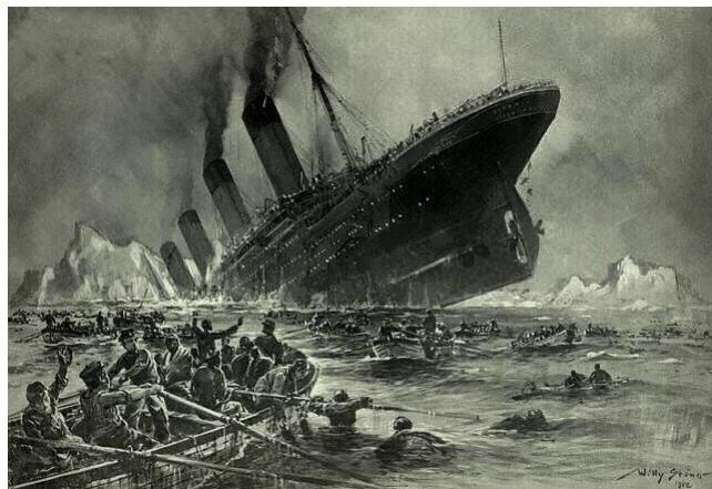
Pictura 2 Naufragium Titanicae navis ( https://la.wikipedia.org/wiki/RMS_Titanic )

Pozn.: marī (abl.) pervagārī – křižovat moře; pervagor, ārī (deponentní sloveso) – procházet, potulovat se (o lodi na moři: křižovat); ūtīle, is, n. – užitečná věc; commercīō (dat.) adhibēre – používat, přibírat k čemu; per quae (vztaž. zájm.) – skrze něž, díky nimž, do nichž; echometrum, ī, n. – sonar; ōrnāre – zdobit, ZDE: vybavit, vybavovat; similiter (adverbium) – podobně; epibat(h)icus, a, um – dopravní; quamquam – ačkoli, i když; mōtrum, ī, n. – motor; māximus, a, um (superlativ) – největší; Novum Eboracum, ī, n. – New York; mīlle quīngentī – 1500; vītam perdidī – přišel jsem o život ( perdidī = perf. od perdō, ere ); pellīcula, ae, f. – film;