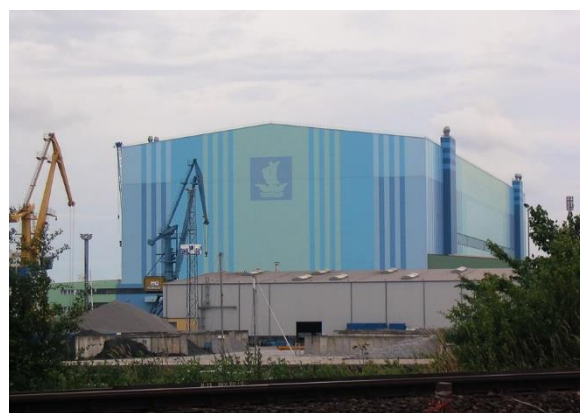
Pictura 3 Navale Stralsundae ( https://la.wikipedia.org/wiki/Navale )

Nāvālia sunt officīna, ubi nāvēs fabricantur et reparantur. Proxima imāgō (v. Pictura 3) dēformat nāvālia Stralsundae; Stralsunda (Germanicē „Stralsund“) est urbs hanseatica in Germāniā. Nāvālia Rōmae commemorat e.g. T. Līvius in librīs „Ab Urbe conditā“.